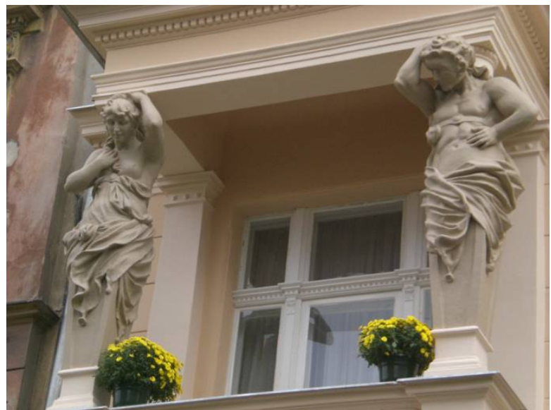
Porovnání stavu domu před a po rekonstrukci.